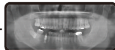
パノラマレントゲン (フィルム)